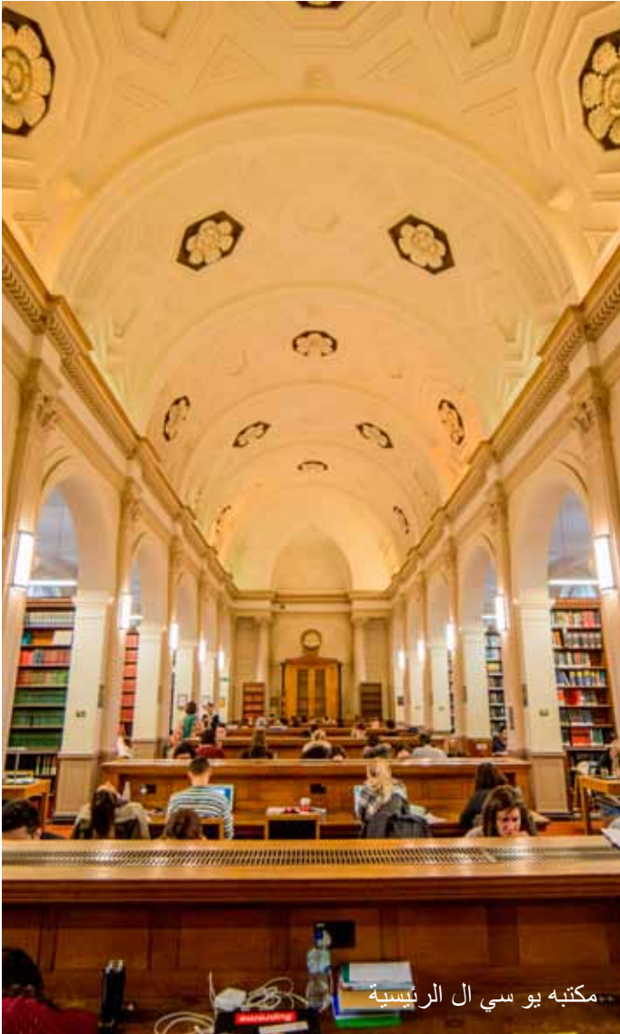
مكتبة يو سي ال الرئيسية