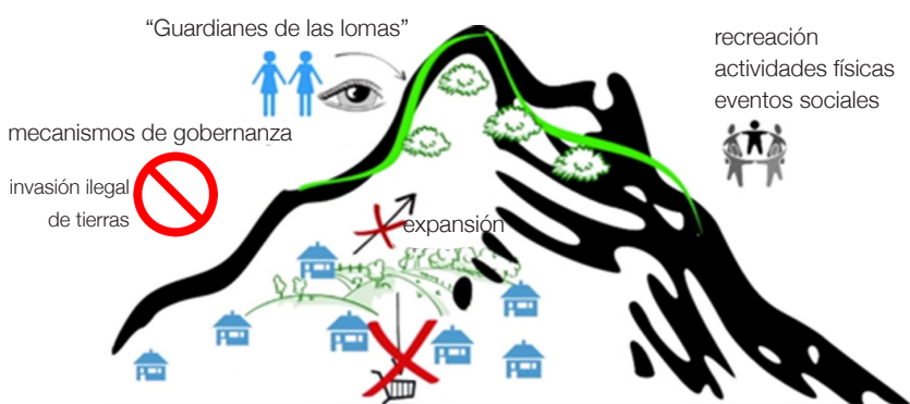
Figura 1. Estrategia 1

Los ingenieros comunitarios podrían estar conformados por miembros de diferentes AF, las cuales tienen diferentes necesidades específicas en cuanto a su