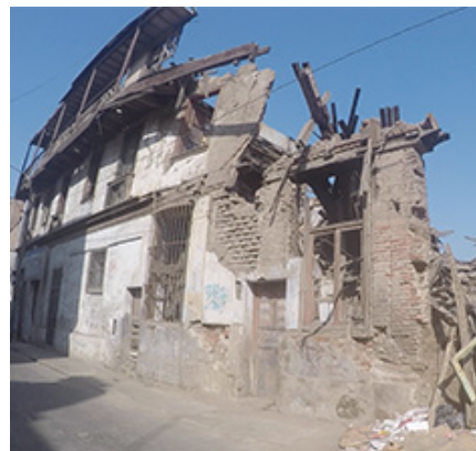
Figura 4. Casa colapsada en El Buque, Barrios Altos, Abril 2016

de información local, al ver en estos estudios el valor y beneficio que suponen para sus propios procesos de planificación (representantes de MML, MINCU y SBLM, 2016). De esta forma, los mapas de riesgo producidos por el INDECI pueden aportar información más completa y actualizada, al ser utilizados en conjunto con los mapas producidos por la comunidad, los cuales reflejan cambios en el uso del suelo.