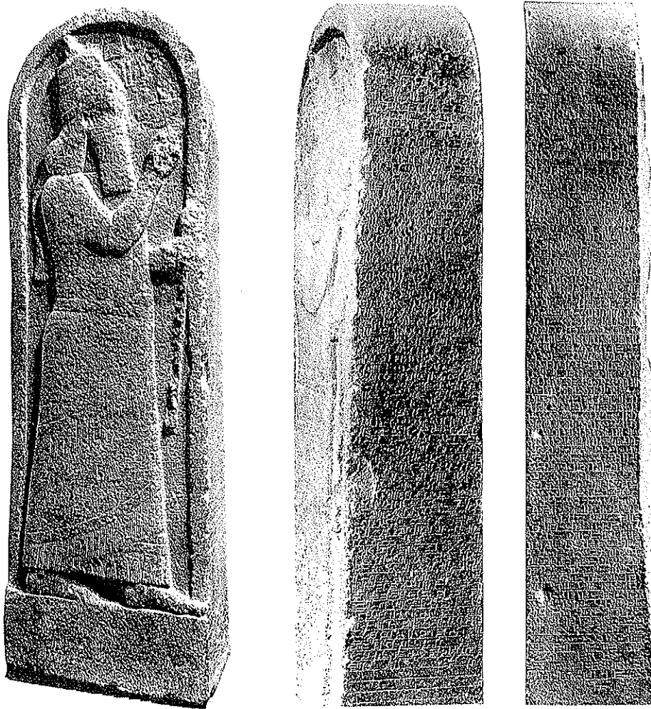
Figure 43. N° 4001 : Stèle de Sargon.

et, pour ce souverain, recevoir de leur part des présents pouvait représenter un succès diplomatique satisfaisant. Son prestige en était accru : il pouvait légitimement proclamer avoir étendu son Empire jusqu'à cette île lointaine et, surtout, ce pouvait être l'acceptation d'une ingérence économique.