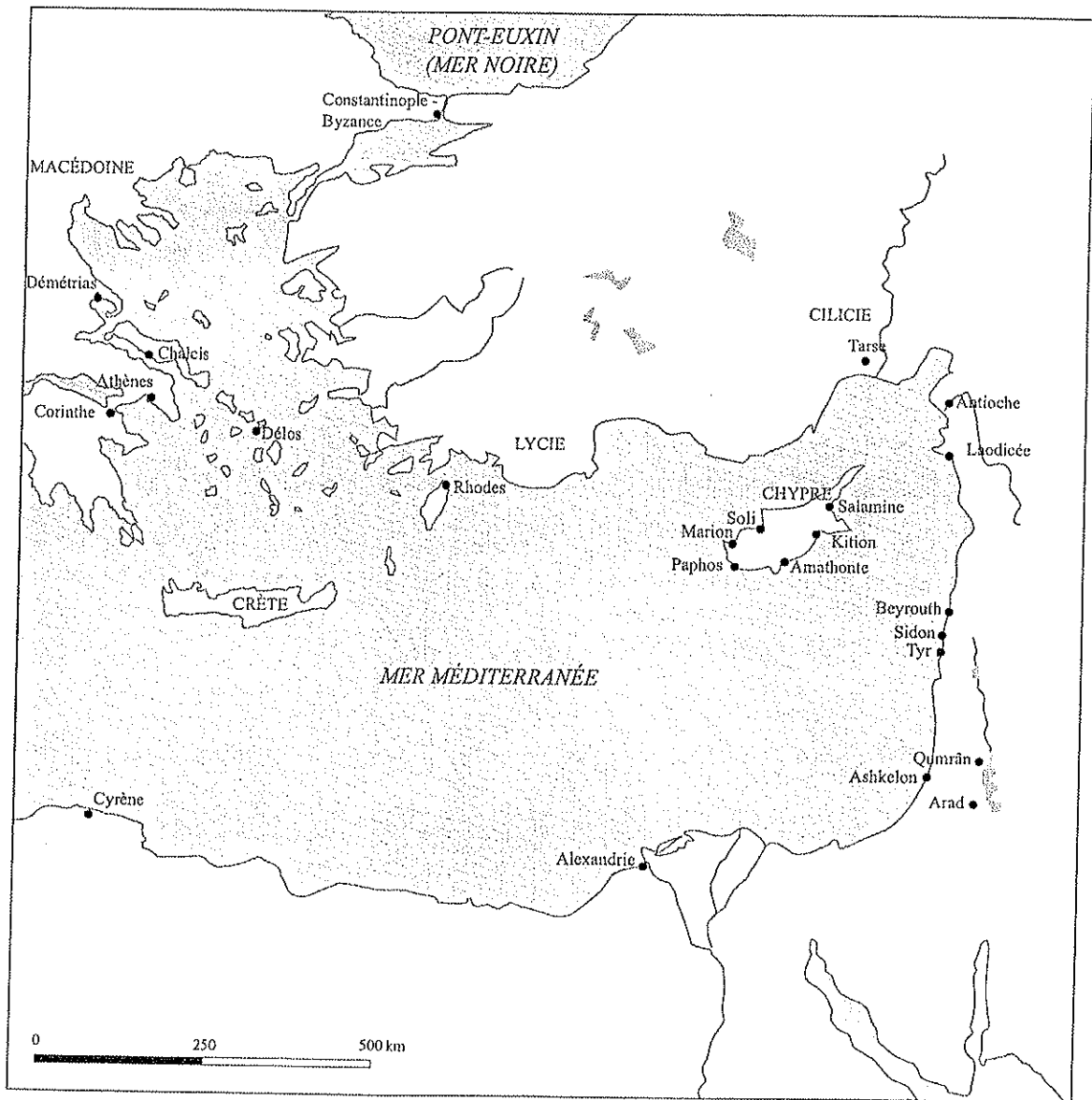
Figure 1. Kition dans le monde antique.