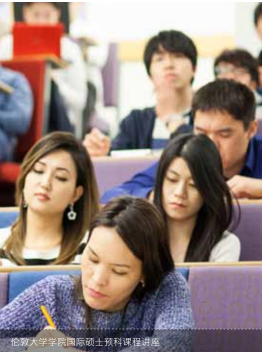
伦敦大学学院国际硕士预科课程讲座