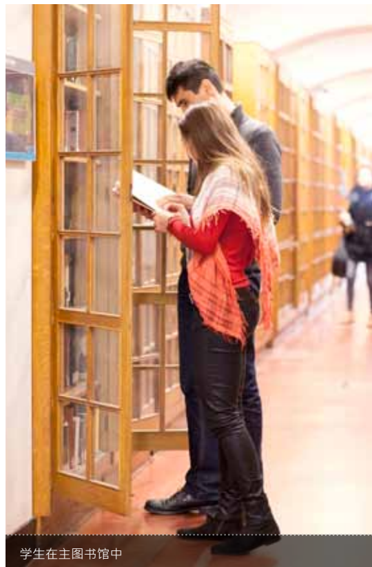
学生在主图书馆中