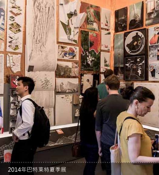
2014年巴特莱特夏季展