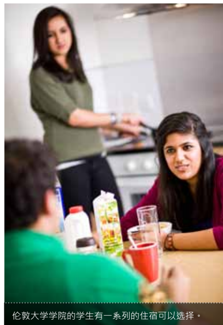
伦敦大学学院的学生有一系列的住宿可以选择。