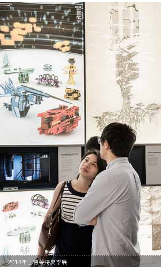
2014年巴特莱特夏季展