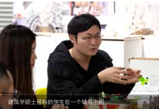
建筑学硕士预科的学生在一个辅导小组