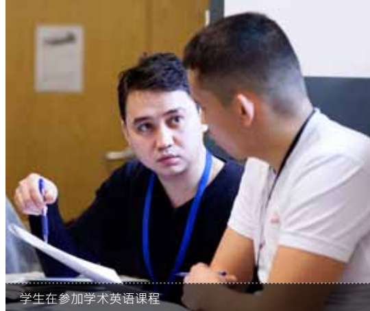
学生在参加学术英语课程

获得其他大学而非伦敦大学学院录取通知的学生，请确认伦敦大学学院的学前英语课程考试成绩能够得到该学校的认可。