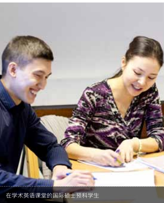
在学术英语课堂的国际硕士预科学生