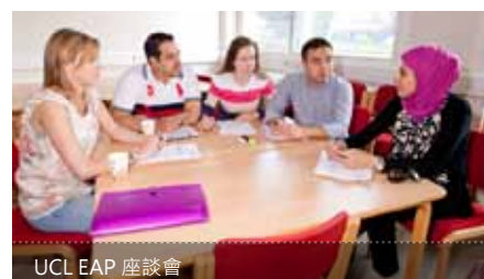
UCL EAP 座談會