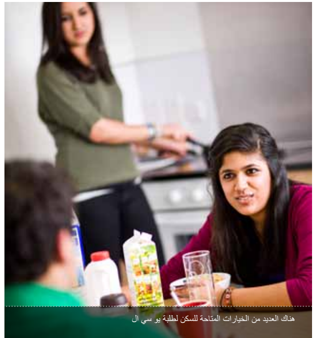
هناك العديد من الخيارات المتاحة للسكن لطلبة يو سي ال

English For Academic Purposes (EAP) UCL Centre for Languages & International Education University College London 26 Bedford Way London WC1H 0AP