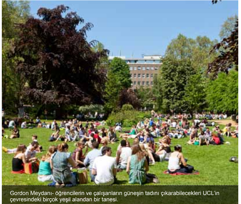
Gordon Meydanı- öğrencilerin ve çalışanların güneşin tadını çıkarabilecekleri UCL'in çevresindeki birçok yeşil alandan bir tanesi.

English For Academic Purposes (EAP) UCL Centre for Languages & International Education University College London 26 Bedford Way London WC1H 0AP