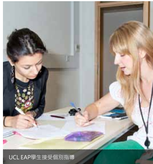
UCL EAP學生接受個別指導