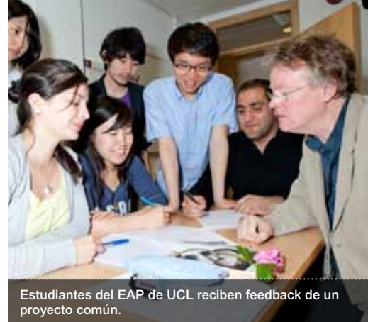
Estudiantes del EAP de UCL reciben feedback de un proyecto común.

Los estudiantes que soliciten plaza en otras universidades deben consultar si se acepta la titulación de Inglés Pre-sesional de UCL y si cumple con sus requisitos de nivel de inglés antes de solicitar una plaza en el curso Pre-sesional de UCL.