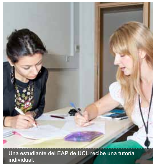
Una estudiante del EAP de UCL recibe una tutoría individual.