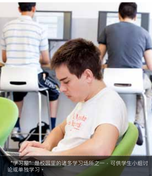
“学习屋”是校园里的诸多学习场所之一，可供学生小组讨论或单独学习。