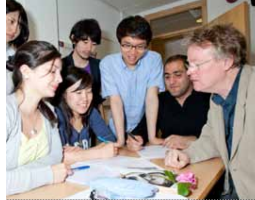
伦敦大学学院学术英语课程学生正在接受小组讨论的反馈。

欲申请英国其它院校学位课程的学生应在申请伦敦大学学院学位预备英语课程前，检查一下伦敦大学学院学位预备英语课程证书是否被其它院校认可为满足英语语言水平要求的证明。