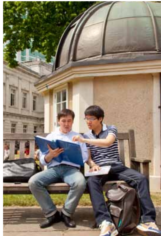
伦敦大学学院学术英语课程学生正在学院外学习。