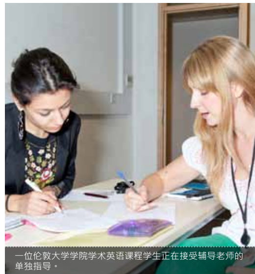
一位伦敦大学学院学术英语课程学生正在接受辅导老师的单独指导。