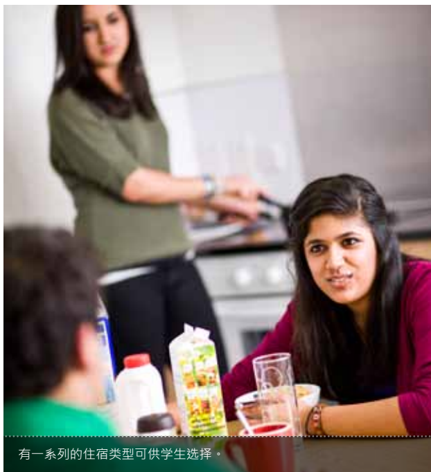
有一系列的住宿类型可供学生选择。