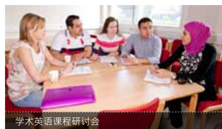
学术英语课程研讨会