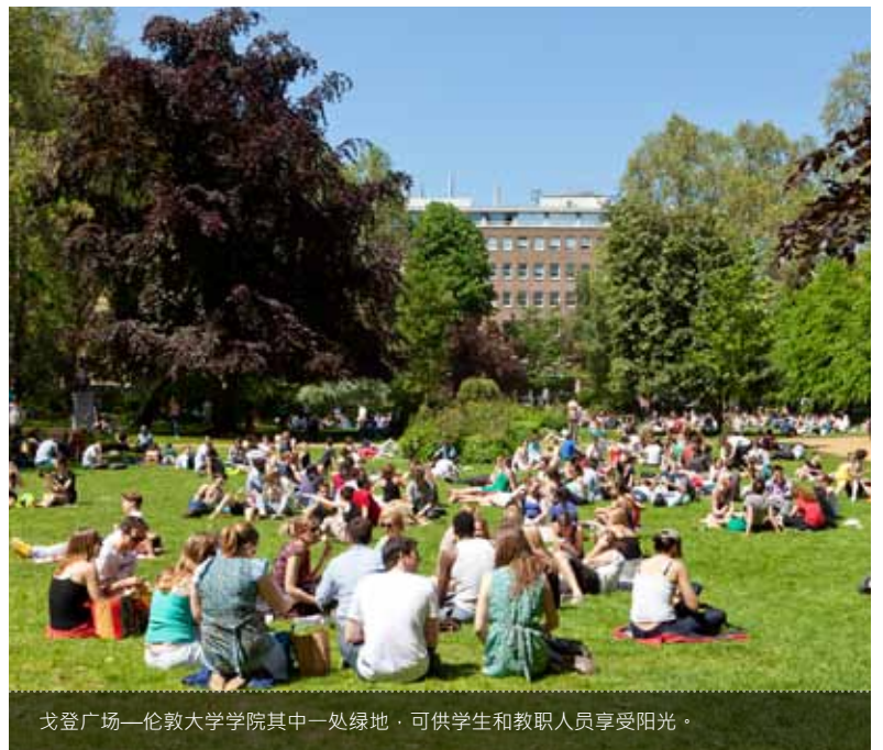
戈登广场—伦敦大学学院其中一处绿地，可供学生和教职人员享受阳光。

学术英语课程 伦敦大学学院语言与国际教育中心 University College London 26 Bedford Way London WC1H 0AP