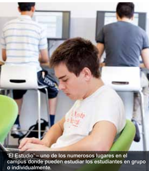
‘El Estudio’ – uno de los numerosos lugares en el campus donde pueden estudiar los estudiantes en grupo o individualmente.