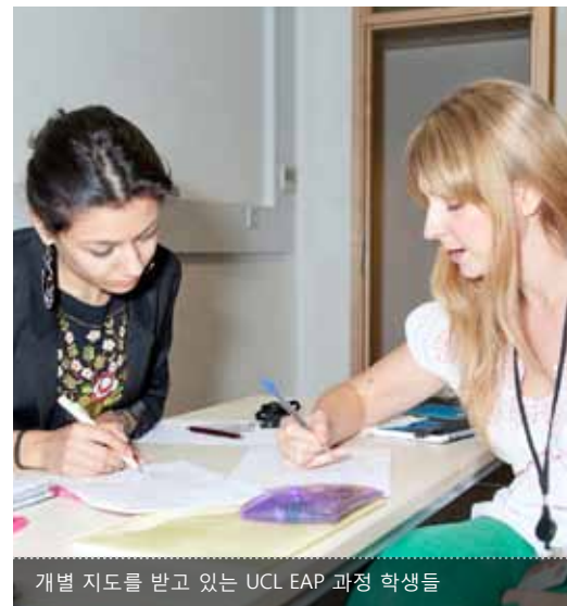
개별 지도를 받고 있는 UCL EAP 과정 학생들