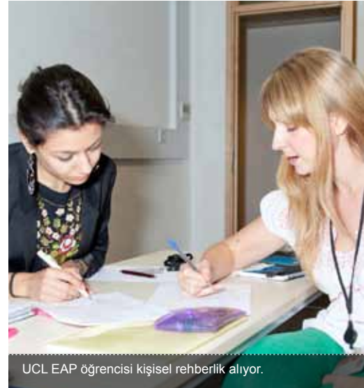
UCL EAP öğrencisi kişisel rehberlik alıyor.