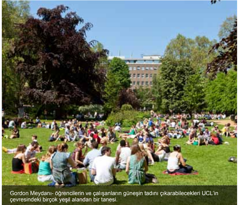
Gordon Meydanı- öğrencilerin ve çalışanların güneşin tadını çıkarabilecekleri UCL'in çevresindeki birçok yeşil alandan bir tanesi.

English For Academic Purposes (EAP) UCL Centre for Languages & International Education University College London 26 Bedford Way London WC1H 0AP