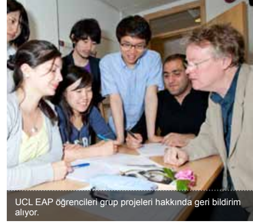
UCL EAP öğrencileri grup projeleri hakkında geri bildirim alıyor.

Diğer üniversitelere başvuran öğrenciler UCL Pre-sessional kursuna başvurmadan önce UCL Pre-sessional İngilizce yeterliliğinin bu okulların İngilizce yeterlik şartlarını karşılayıp karşılamadığını kontrol etmelidir.