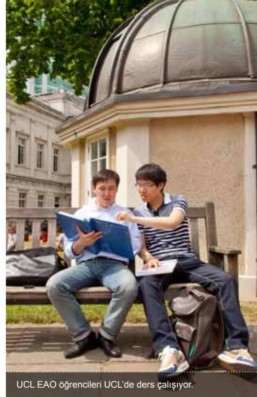
UCL EAO öğrencileri UCL'de ders çalışıyor.