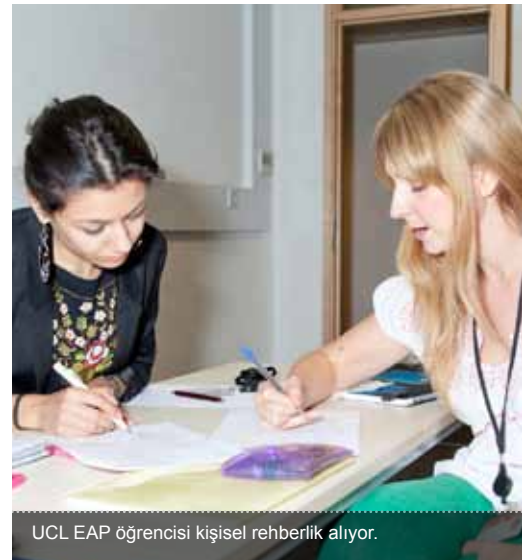
UCL EAP öğrencisi kişisel rehberlik alıyor.