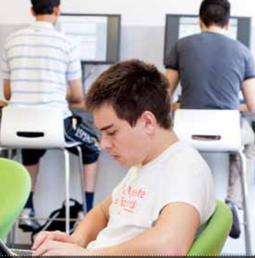
'The Study'- öğrencilerin kampüste grup halinde ya da bireysel olarak çalışabilecekleri birçok alandan bir tanesi.