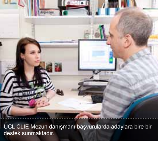
UCL CLIE Mezun danışmanı başvurulara adaylara bire bir destek sunmaktadır.