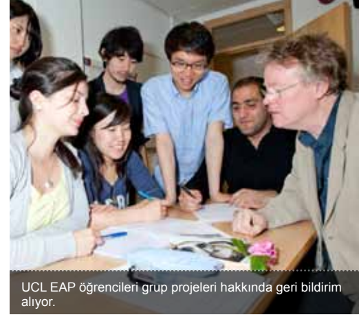
UCL EAP öğrencileri grup projeleri hakkında geri bildirim alıyor.

Diğer üniversitelere başvuran öğrenciler UCL Pre-sessional kursuna başvurmadan önce UCL Pre-sessional İngilizce yeterliliğinin bu okulların İngilizce yeterlik şartlarını karşılayıp karşılamadığını kontrol etmelidir.