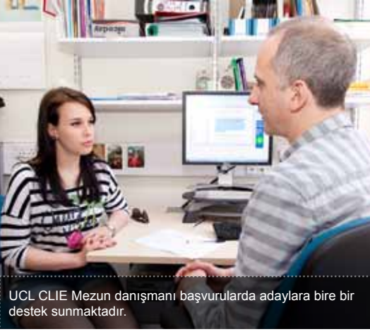
UCL CLIE Mezun danışmanı başvurulara adaylara bire bir destek sunmaktadır.