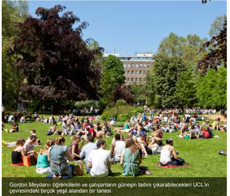
Gordon Meydanı- öğrencilerin ve çalışanların güneşin tadını çıkarabilecekleri UCL'in çevresindeki birçok yeşil alandan bir tanesi.