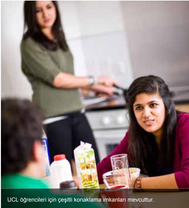
UCL öğrencileri için çeşitli konaklama imkanları mevcuttur.