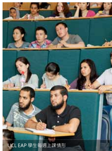
UCL EAP 學生每週上課情形