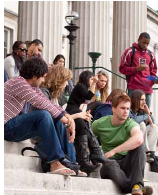
مكتبة كلية جامعة لندن (يوسا) الرئيسية بالخارج - مكان شهير لطلبة وأكاديمي جامعة كلية لندن للراحة ، والتقابل والتحدث والدراسة

Diploma in English for Academic Purposes