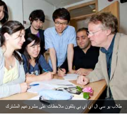
طلاب يوسي ال أي بي يتلقون ملاحظات على مشروعهم المشترك