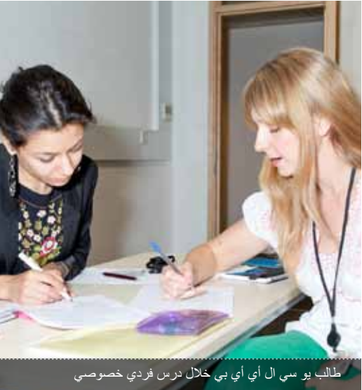
طلاب يوسي ال أي بي خلال درس فردي خصوصي