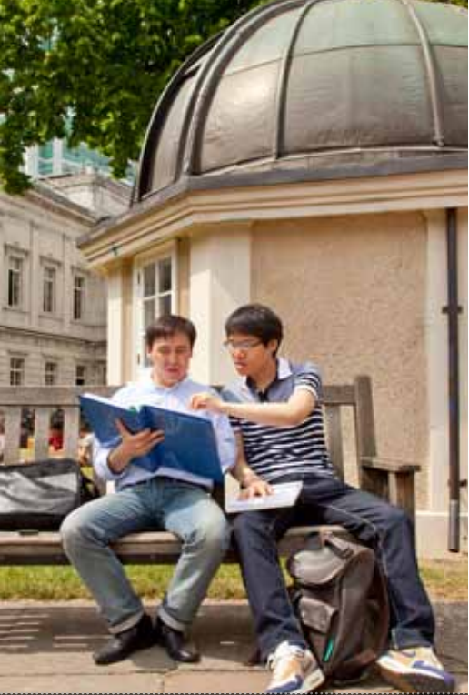
طلاب يوسي ال أي بي يتفنون ملاحظات على مشروعهم المشترك