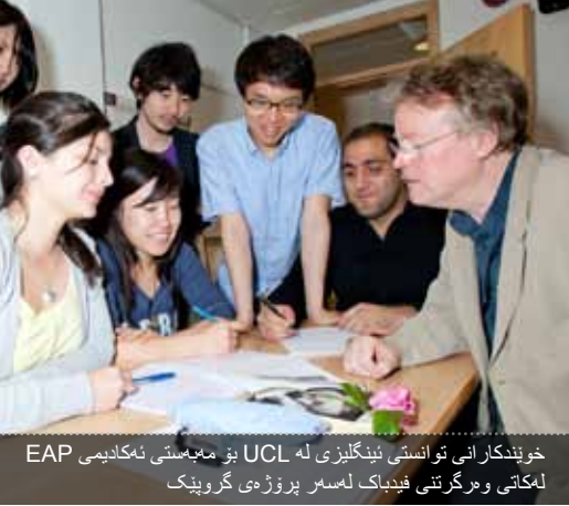
خويندىكارانى ئوانستى ئىنگلىزى لە UCL بۇ مەبەستى ئەكادىمىيە EAP لەكاتى وەرگرتتى فېدباك لەسەر پروژەى گروپىك

ئەم خويندىكارانەى داواكارىيان پىشەكەشەمگردووە بۇ خويندىن لەزانكۆكى تىر، بەر لەمەى خۇيان بۇ كورسى ئىنگلىزىيى پىشومختى زانكۆى UCL ناونووس بەكەن پىويستە دۇنيا بن لەمەى بروانامەى كورسى ئىنگلىزىيى پىشومختى زانكۆى UCL گونجاو لەگەل ئاستى ئوانستى زمانى ئىنگلىزى كە لەلايەن ئەم زانكۆيانەمە داواكاراوە.