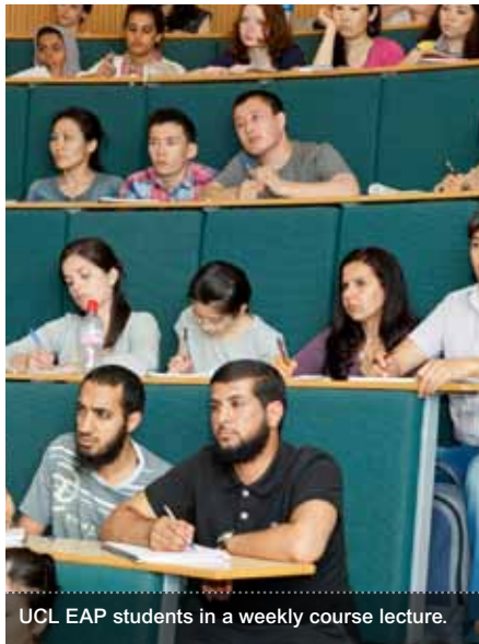
UCL EAP students in a weekly course lecture.