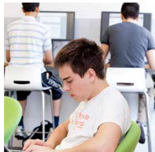
خۆيندنگە (The Study) يەكەكە لەچەندىن شونىيى كامپى زانکۆ كە خۆيندكاران دەتوانن بەگروپ يان بە تەئنا تىبدا بخويننەو.

۲ – ئەم وەرزە بايەخەدەت بە گەشەكردى توانستى تۆزىنەو سەرەخۆ، توانستى نووسىنى ئەكادىمى لەتۆزىنەو و كارامەىيە پىشكەشكردى نەمايش (Presentation). ئەم بايەتەش پەيوستن بە بايەتى ئەكادىمى ھەلبۇزىرداوى قوتابىيەو (وكمو: ئەندازە، ياسا، ھەتد) و دەرفەتى بۆ دەرمخسنىت زباتر پەريان پىندەت. ئەم توانست و كارامەىيەى لەمەرزى يەكەمدا جى بەياخ بوون بەھەمان شتو لەم وەرزەشدا پەريان پىندەدرىت.