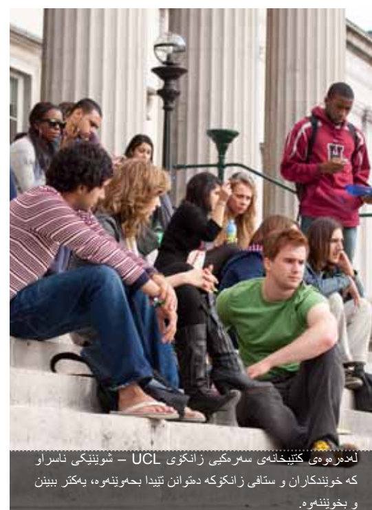
لەدەرەوئى كىتەخانەى سەرەكى زانکۆى UCL – شونىيىكى ناسراو كە خۆيندكاران و ستافى زانکۆكە دەتوانن تىبدا بەجەوئەو، يەكتر بىيىن و بخويننەو.

كارى تۆزىنەو بەوردى رىنوونى و پشنگىرى دەكرىت لەرىي وائەى تايبەتى ھەفتانەو. وائەكانى ھەفتە دەرفەتىكى باش بۆ خۆيندكار دەرمخسنىن بۆ فراوانكردى لایەنى زانستى و زارەوسازىيە بايەتەكەى.