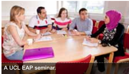
A UCL EAP seminar.

پەرەپێدانی توانستەکان، بەدیھێنانی ئامانجەکان لەسەنتەری زانکۆی کۆلیژی لەندەن بۆ زمان و پەرورەدی نیودەولەتی