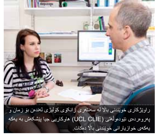
راویزکاری خۆیندى بالآ له سەنتەرى زانکۆى کۆلیزى لەئەندەن بۆ زمان و پەرودەى نۆدەولمى (UCL CLIE) ھاوکارى جیا پىشکەش بە يەكە يەكەى خوازىارانى خۆیندى بالآ دەکات.