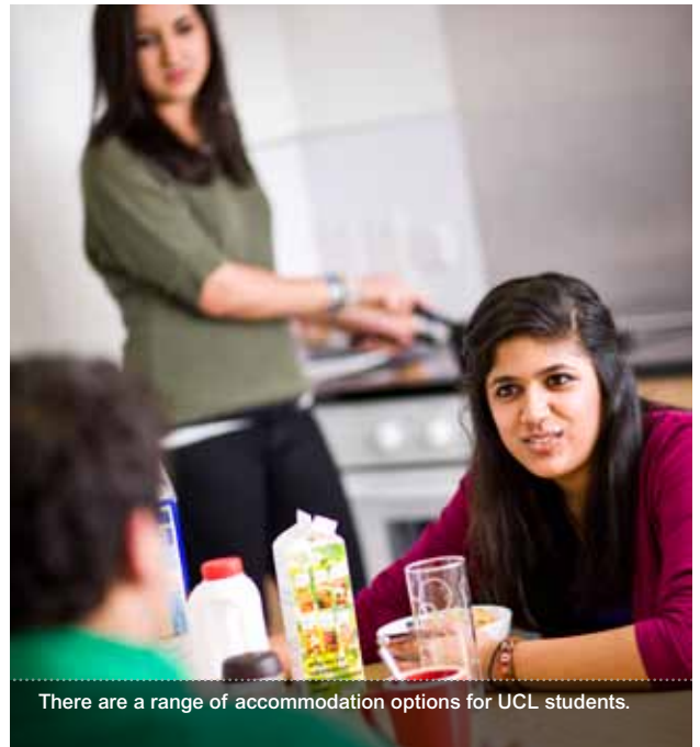
There are a range of accommodation options for UCL students.

English For Academic Purposes (EAP) UCL Centre for Languages & International Education University College London 26 Bedford Way London WC1H 0AP