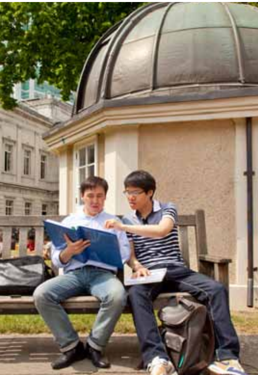
خويندىكارانى ئوانستى ئىنگلىزى لە UCL بۇ مەبەستى ئەكادىمىيە EAP لەكاتى خويندىندا لەدەر مەوى زانكۆى UCL