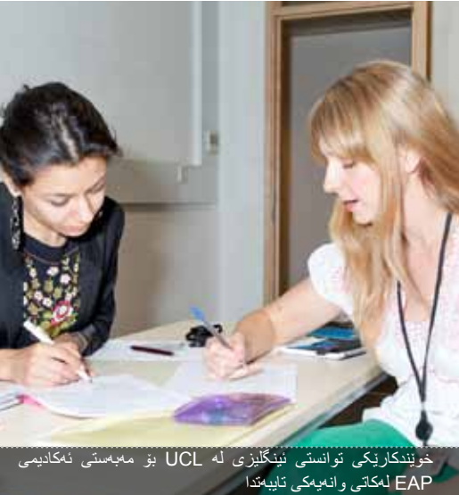
خويندىكارىكى ئوانستى ئىنگلىزى لە UCL بۇ مەبەستى ئەكادىمىيە EAP لەكاتى وانەمەكى تايىمەدا