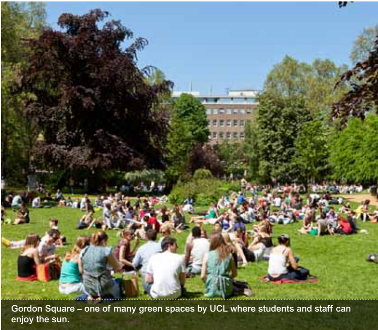
Gordon Square – one of many green spaces by UCL where students and staff can enjoy the sun.