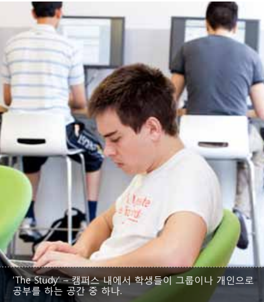
'The Study' - 캠퍼스 내에서 학생들이 그룹이나 개인으로 공부할 수 있는 공간 중 하나.