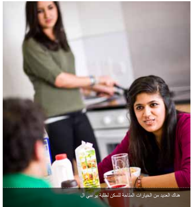
هناك العديد من الخيارات المتاحة للسكن لطلبة يو سي ال

English For Academic Purposes (EAP) UCL Centre for Languages & International Education University College London 26 Bedford Way London WC1H 0AP