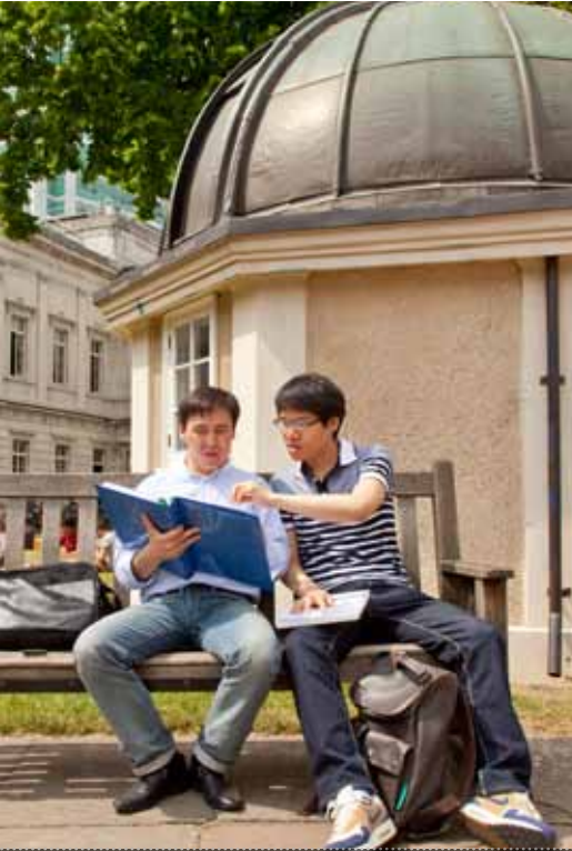
طلاب يوسي ال أي بي يتفنون ملاحظات على مشروعهم المشترك