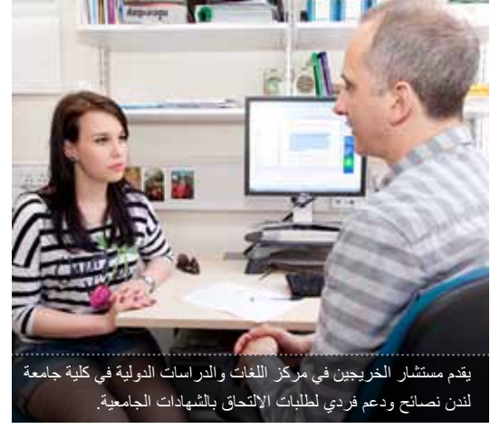
يقدم مستشار الخريجين في مركز اللغات والدراسات الدولية في كلية جامعة لندن نصائح ودعم فردي لطلبات الالتحاق بالشهادات الجامعية.