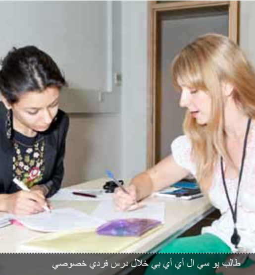
طلاب يوسي ال أي بي خلال درس فردي خصوصي