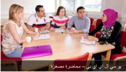
يو سي ال أي بي - محاضرة مصغرة

تطوير لمهاراتك ، وتحقيق لمستوى أعلى من أهدافك في مركز اللغات والدراسات الدولية في كلية جامعة لندن (يو سي ال أي بي)