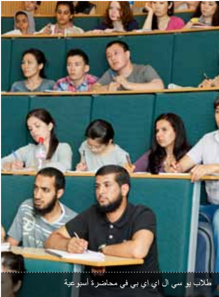
طلاب يو سي ال أي بي في محاضرة أسبوعية