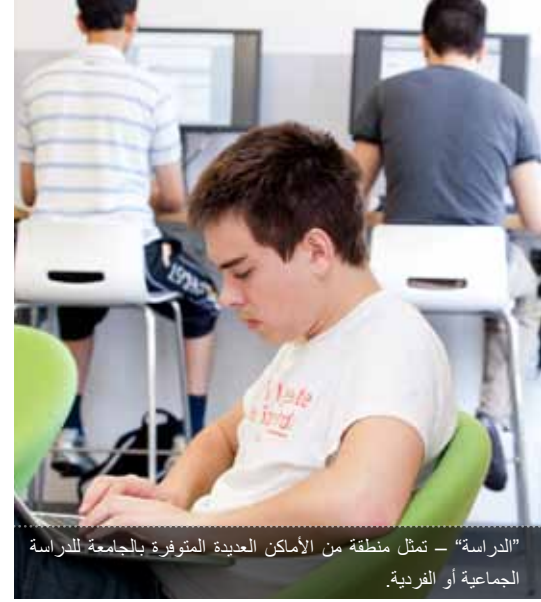
"الدراسة" - تمثل منطقة من الأماكن العديدة المتوفرة بالجامعة للدراسة الجامعية أو الفردية.