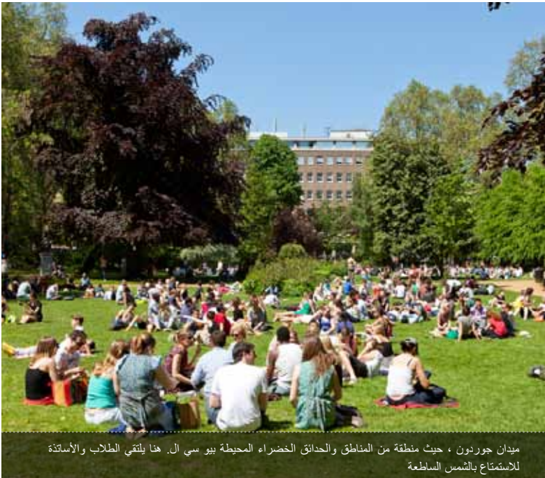
ميدان جوردون ، حيث منطقة من المناطق والحدائق الخضراء المحيطة بيو سي ال. هنا يلتقي الطلاب والأساتذة للاستمتاع بالشمس الساطعة