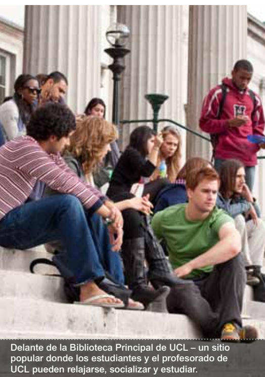
Delante de la Biblioteca Principal de UCL – un sitio popular donde los estudiantes y el profesorado de UCL pueden relajarse, socializar y estudiar.