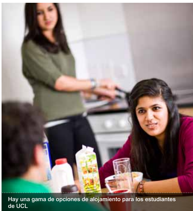
Hay una gama de opciones de alojamiento para los estudiantes de UCL