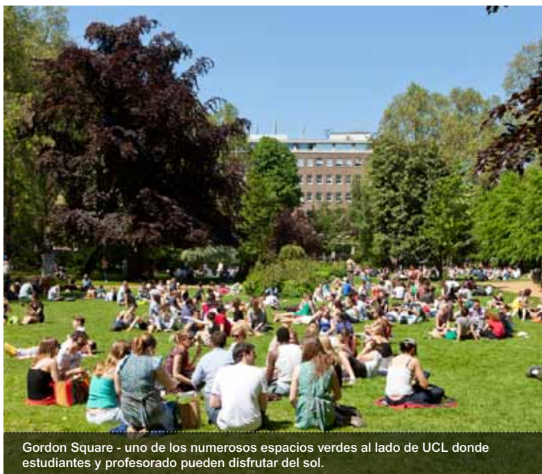
Gordon Square - uno de los numerosos espacios verdes al lado de UCL donde estudiantes y profesorado pueden disfrutar del sol.

English For Academic Purposes (EAP) UCL Centre for Languages & International Education