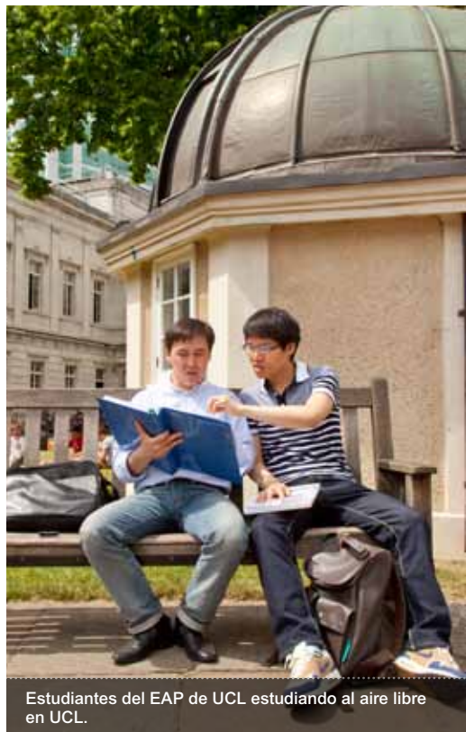
Estudiantes del EAP de UCL estudiando al aire libre en UCL.