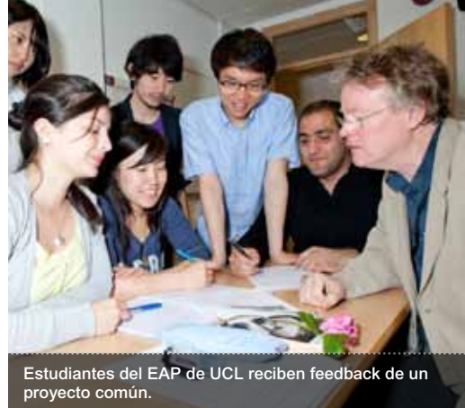
Estudiantes del EAP de UCL reciben feedback de un proyecto común.

Los estudiantes que soliciten plaza en otras universidades deben consultar si se acepta la titulación de Inglés Pre-sesional de UCL y si cumple con sus requisitos de nivel de inglés antes de solicitar una plaza en el curso Pre-sesional de UCL.