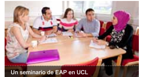
Un seminario de EAP en UCL

*La "sesión de clase" en UCL es de 50 minutos