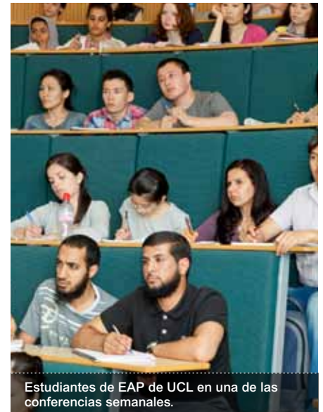
Estudiantes de EAP de UCL en una de las conferencias semanales.