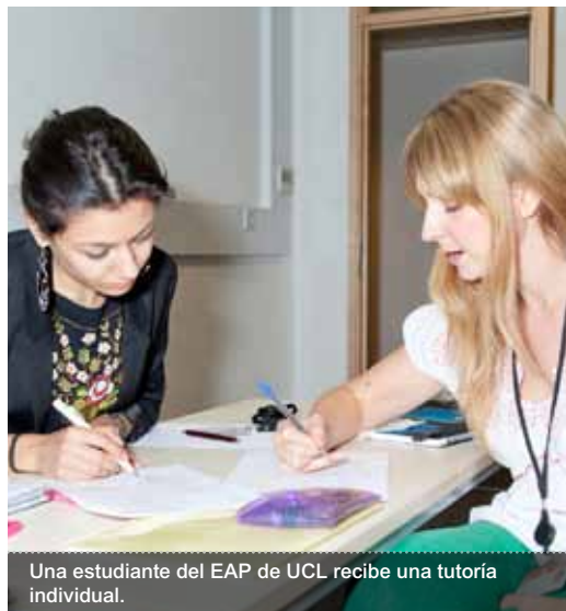
Una estudiante del EAP de UCL recibe una tutoría individual.