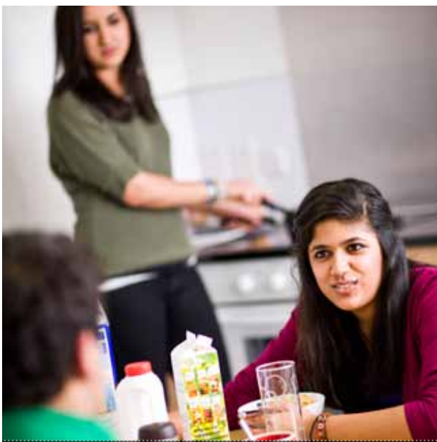
UCL 학생들이 선택할 수 있는 다양한 조건의 기숙사들이 마련되어 있습니다.