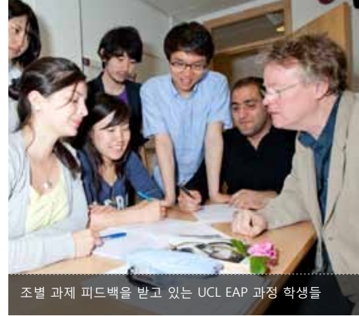
조별 과제 피드백을 받고 있는 UCL EAP 과정 학생들

다른 대학으로 지원하려는 학생들은 UCL Pre-sessional 코스에 지원하기 전에 먼저, 그들의 어학 능숙도 조건을 충족시키기 위해 UCL Pre-sessional 영어 자격이 되는지 체크해봐야 합니다.