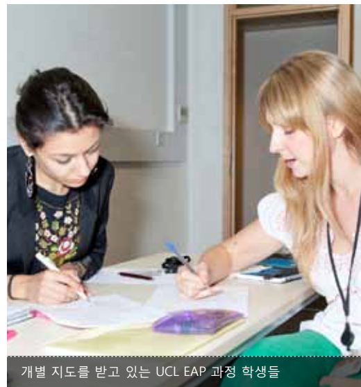
개별 지도를 받고 있는 UCL EAP 과정 학생들