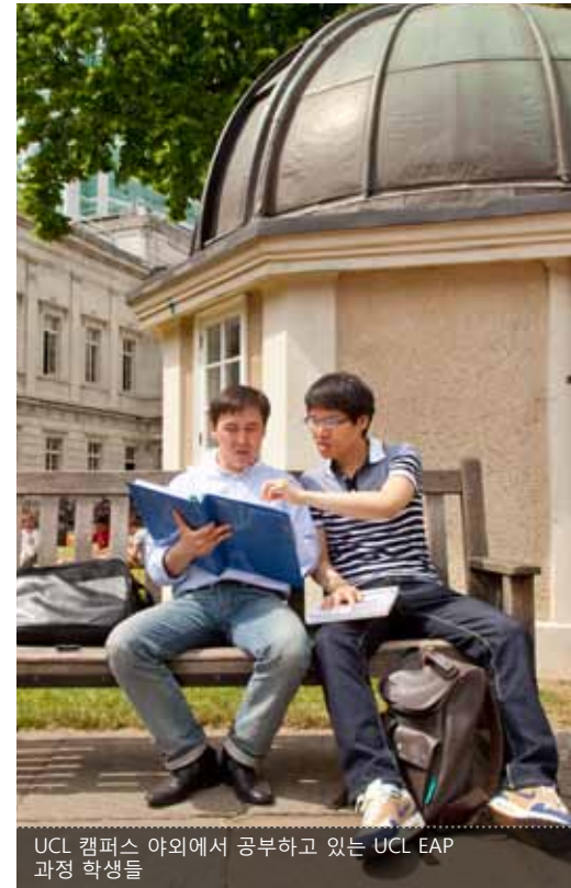
UCL 캠퍼스 야외에서 공부하고 있는 UCL EAP 과정 학생들