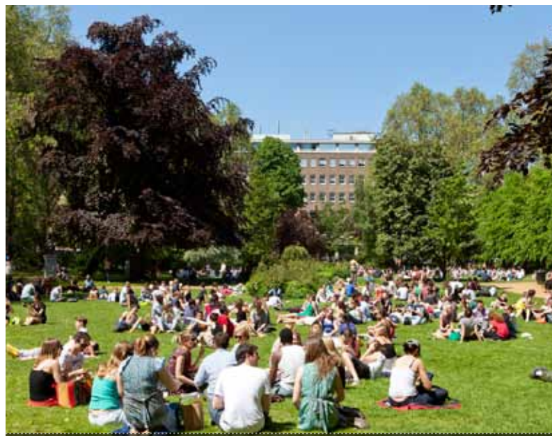
고든 스퀘어 - 학생과 교직원들이 만끽할 수 있는 UCL 캠퍼스의 수많은 야외 조경공간 중 하나입니다.

English For Academic Purposes (EAP) UCL Centre for Languages & International Education University College London 26 Bedford Way London WC1H 0AP