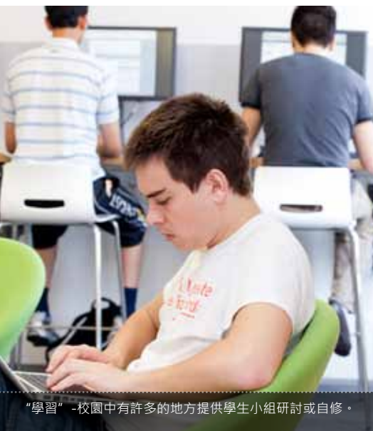
“學習”-校園中有許多的地方提供學生小組研討或自修。