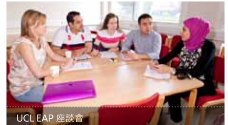
UCL EAP 座談會