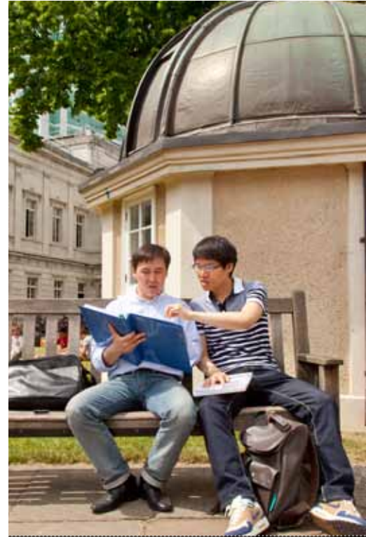
UCL EAP學生在校園內討論課業