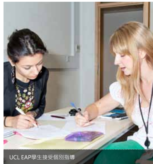
UCL EAP學生接受個別指導