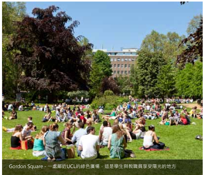
Gordon Square - 一處鄰近UCL的綠色廣場，這是學生與教職員享受陽光的地方

English For Academic Purposes (EAP) UCL Centre for Languages & International Education University College London 26 Bedford Way London WC1H 0AP