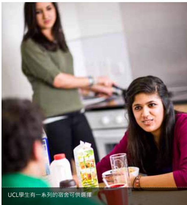
UCL學生有一系列的宿舍可供選擇