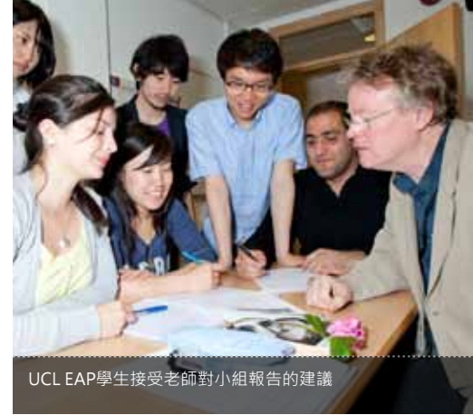
UCL EAP學生接受老師對小組報告的建議

在申請倫敦大學學院學術英語先修課程之前，申請其他大學的學生應該確認是否該校認可倫敦大學學院學術英語先修課程能滿足其英語水準要求。