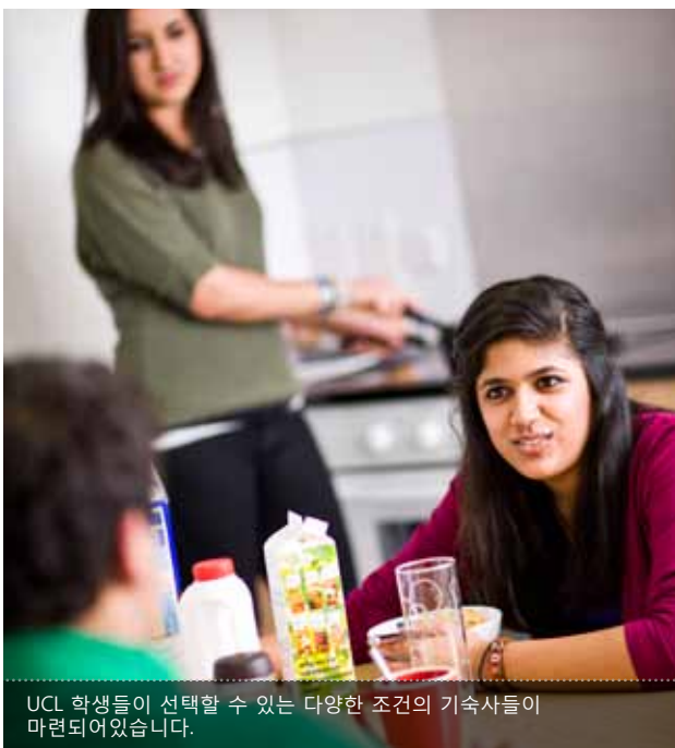
UCL 학생들이 선택할 수 있는 다양한 조건의 기숙사들이 마련되어 있습니다.