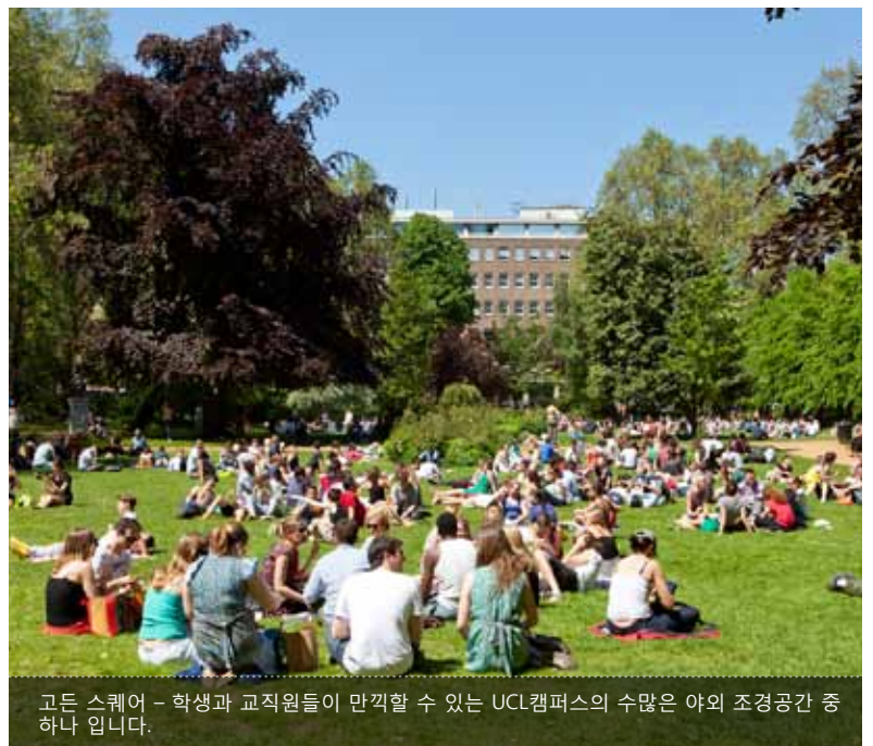
고든 스퀘어 - 학생과 교직원들이 만끽할 수 있는 UCL 캠퍼스의 수많은 야외 조경공간 중 하나입니다.

English For Academic Purposes (EAP) UCL Centre for Languages & International Education University College London 26 Bedford Way London WC1H 0AP