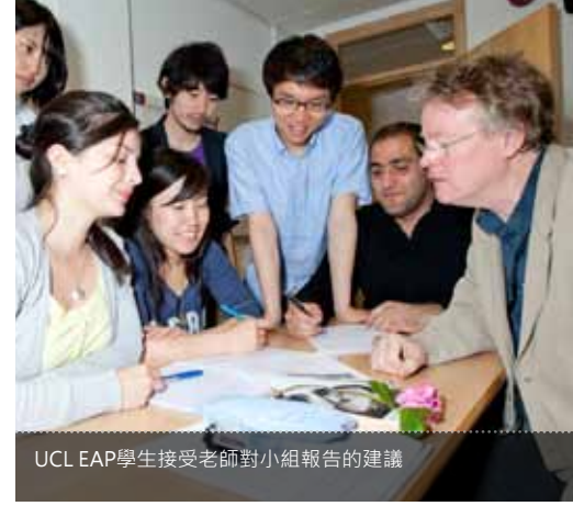
UCL EAP學生接受老師對小組報告的建議

在申請倫敦大學學院學術英語先修課程之前，申請其他大學的學生應該確認是否該校認可倫敦大學學院學術英語先修課程能滿足其英語水準要求。