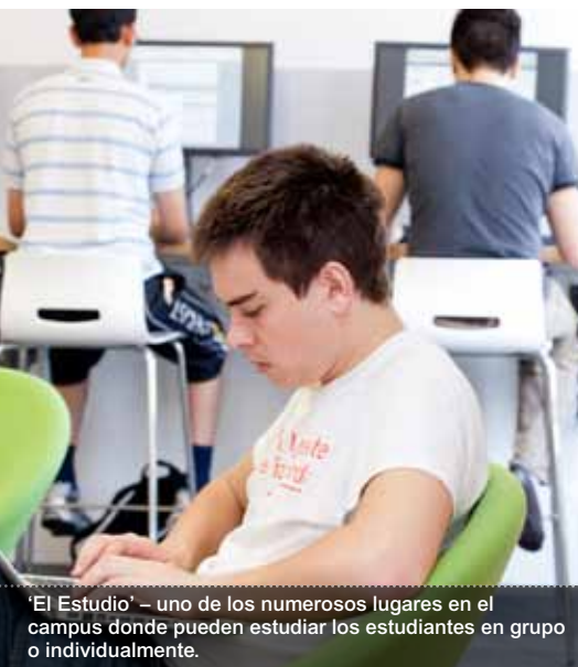
‘El Estudio’ – uno de los numerosos lugares en el campus donde pueden estudiar los estudiantes en grupo o individualmente.